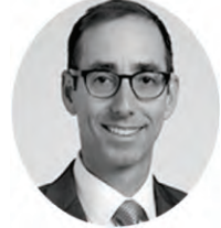
Howard B. Goldman, MD, FACS Clínica Cleveland Cleveland(OH), Estados Unidos